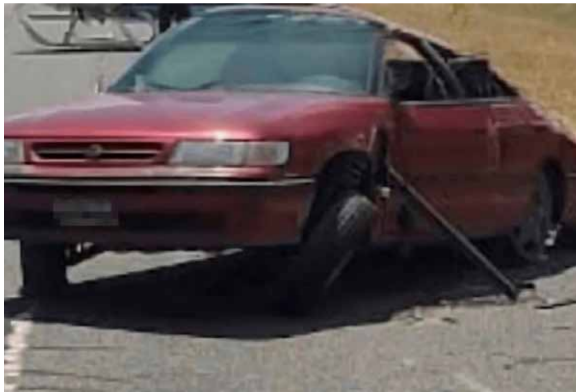
Dos menores. Fallecieron en un accidente fatal en Ruta 11.

Una mujer permanece herida tras el trágico accidente vial