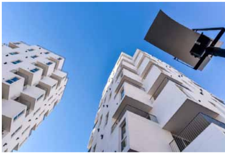
Novedades sobre los precios de los alquileres

En enero las boletas finales para los usuarios de luz aumentarán 1,6% para la luz en el Área Metropolitana de Buenos Aires (AMBA) y de 1,82% en el gas natural por red para todo el país. Dichas subas se ubican por debajo