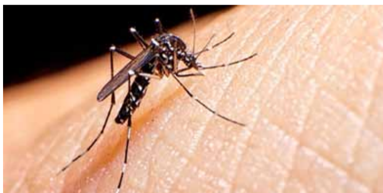
Infectólogos. Recomiendan la vacuna contra el dengue por precaución

En cuanto a la vacunación, expresó su preocupación porque “los