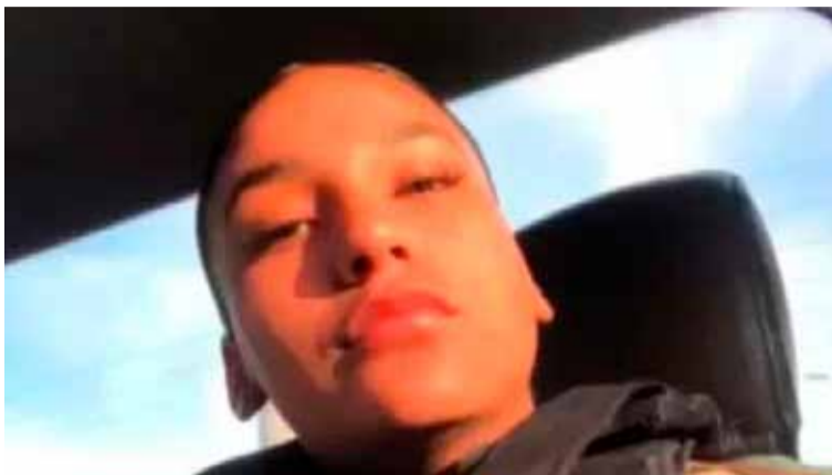
Misterio. Policía asesinada en Mar del Plata; investigan a su novio.

La víctima, que estuvo destinada en Necochea, había egresado recientemente de la Policía y