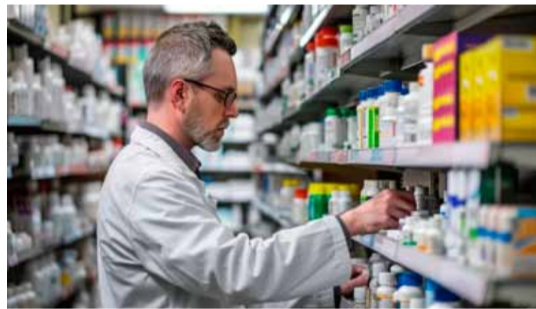
Coexistirán. Recetas digitales y en papel