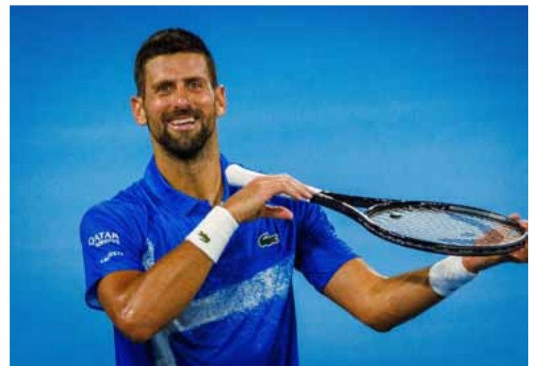
Djokovic sigue ganando

La mala para el equipo es que no logró marcar y perdió en sus dos últimos partidos de la Supercopa de Italia (0-1 contra la Juventus en 2019 y 0-3 contra el Inter en 2023), después de haber marcado al menos una vez en todos sus 10 partidos anteriores en el torneo, obteniendo cinco victorias, tres empates y dos derrotas.