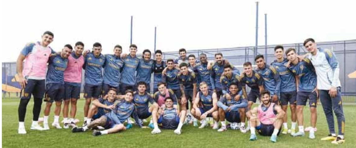
El plantel de Boca Juniors comenzó su preparación de cara a un año de mucha competencia

El "Xeneize" tendrá su primer amistoso ante Juventude de Brasil el 15 de enero