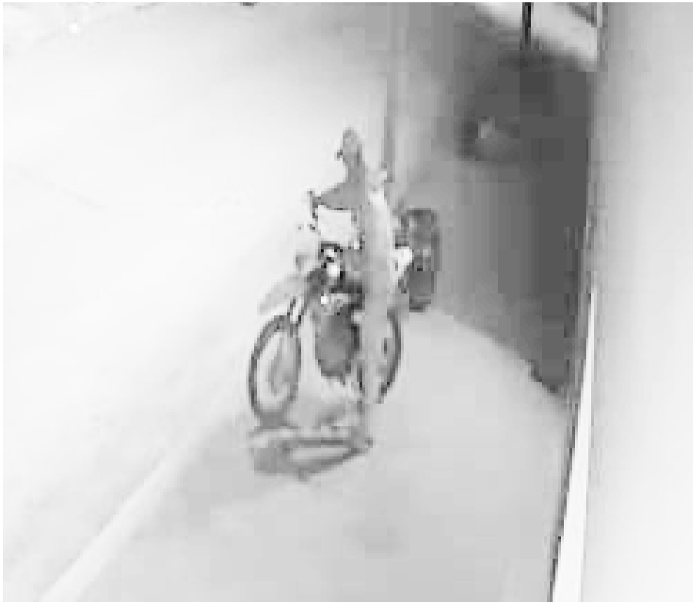
Captura del video en el que se observa la sustracción del motovehículo.

Como resultado del rápido accionar policial investigativo y en operativo conjunto de Sub DDI Bolívar y Sub DDI Olavarría en el mediodía de ayer se logró el recupero de una motocicleta Honda XR150 que fue robada horas antes en esta ciudad y hallada horas después en la ciudad de Olavarría. La persona que habría cometido el ilícito se encuentra ya identificada, y