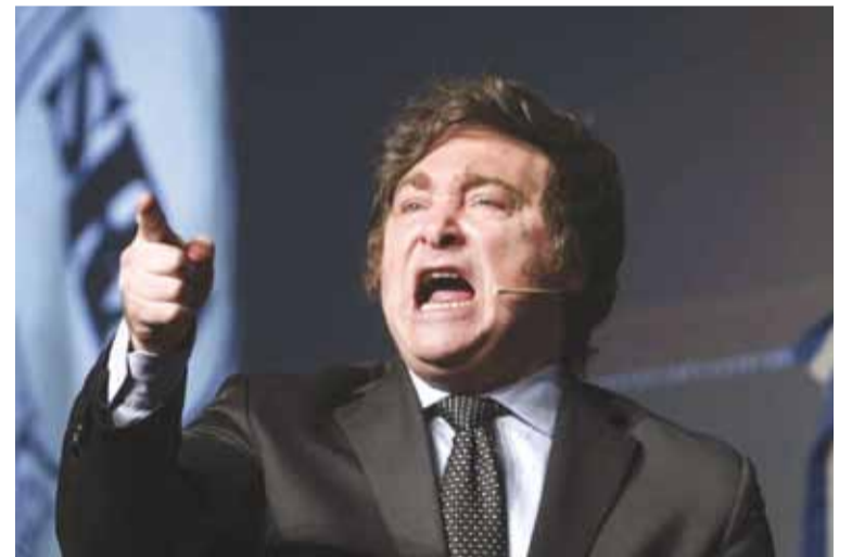
The Telegraph elogió el primer año de Milei

“Excluyendo los costos de los intereses de la deuda, el país finalmente está viviendo dentro de sus posibilidades. A pesar de estos fuertes recortes del gasto, la tercera economía más grande de América Latina también está creciendo nuevamente. La Argentina salió de la recesión en el tercer trimestre con un crecimiento del 3,9%. Los economistas dicen que Milei ha logrado una hazaña nada menos que hercúlea”, añade la editora.