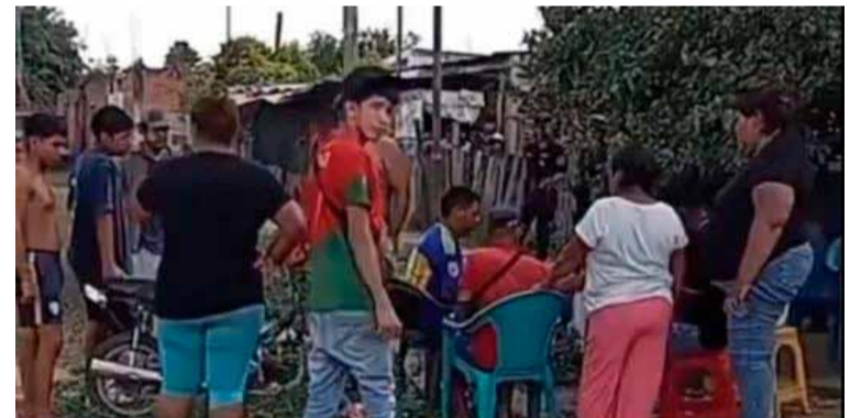
Primer homicidio. De 2025 ocurrió tras una pelea en Salta

Por último, el suceso fue caratulado como homicidio, y se espera que en las próximas horas las autoridades brinden más detalles sobre la investigación.///