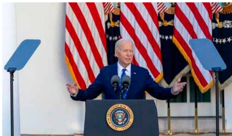
Investigación. El presidente Biden brindó detalles del hecho

“El FBI también me informó de que pocas horas antes del ataque, publicó videos en las redes sociales indicando que estaba inspirado por el ISIS y expresando el deseo de matar”, enfatizó Biden en una declaración a la