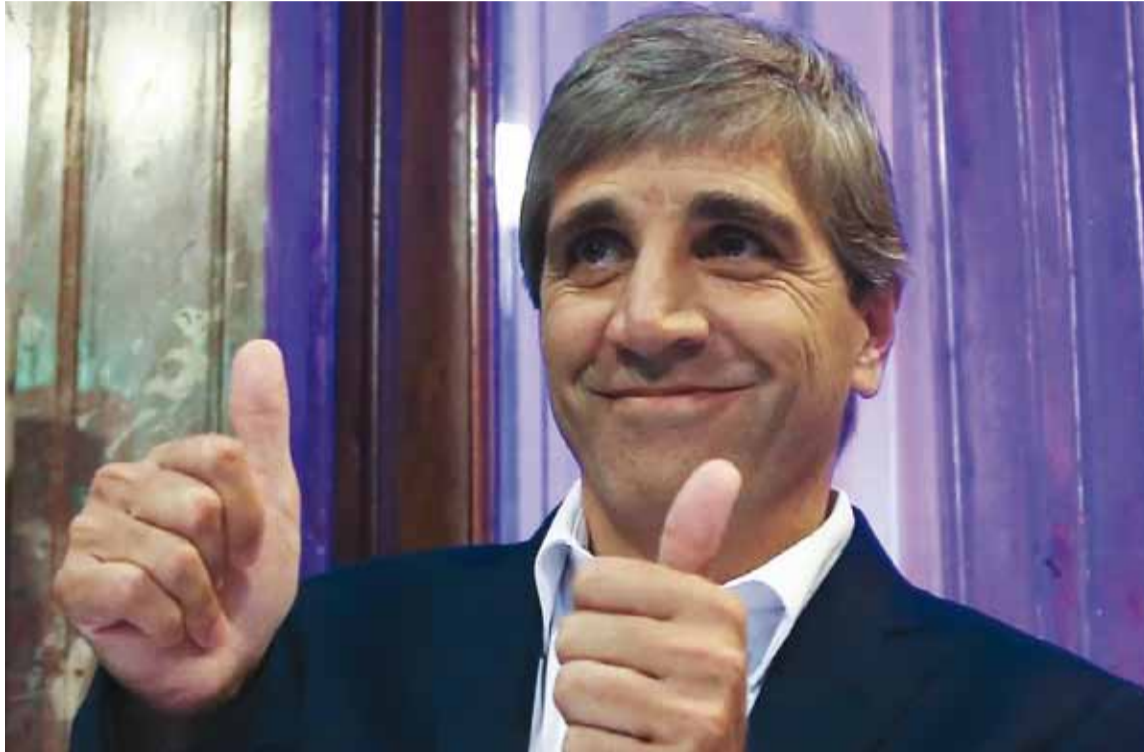
Luis Caputo, ministro de Economía del gobierno de Milei

El Tesoro aprovechó el superávit fiscal para comprar las divisas necesarias