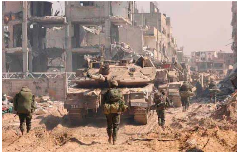
Operativo israelí. Habría eliminado a líder de Hamás

Israel bombardeó hasta en 347 ocasiones el territorio sirio en 2024, la mayor cifra anual de ataques aéreos contra Siria desde que inició sus acciones en 2018 con el pretexto de combatir la presencia de Irán, aliada del depuesto presidente sirio, Bachar al Asad, en el país árabe, informó este jueves